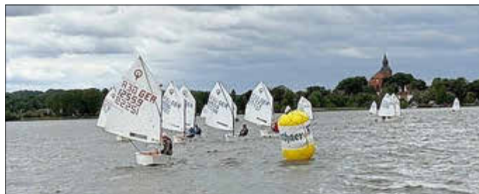
Die Optimisten beim Tonnen Rundung

holz aus Rostock (1., 4. 7. Platz). Die Rostocker gehörten zu den gekenterten Booten in der 3. Wettfahrten. Sie konnten aber ihr Boot wieder aufrichten und die Wettfahrt dann noch als siebenten beenden.