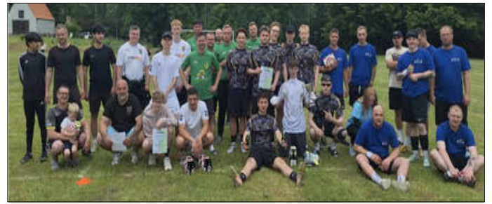
Teilnehmer des Fußballturniers