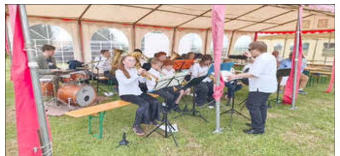
Musikalische Unterhaltung durch die Krümelmonster der Musikschule Wismar

Die Gemeinde bedankt sich herzlich bei allen ehrenamtlichen Helferinnen und Helfern, Vereinen, Unterstützern und Sponsoren, die dieses Fest möglich gemacht haben.